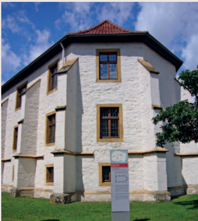
Das Süsterhaus in Lemgo

Tel.: 0 52 61 / 213-413 | E-Mail: stadtarchiv@lemgo.de