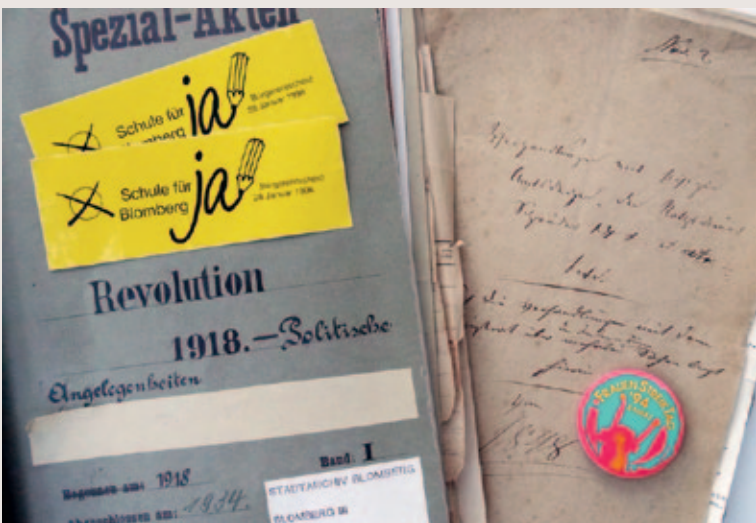
Demokratie und Bürgerrechte in zwei Jahrhunderten (Stadtarchiv Blomberg)