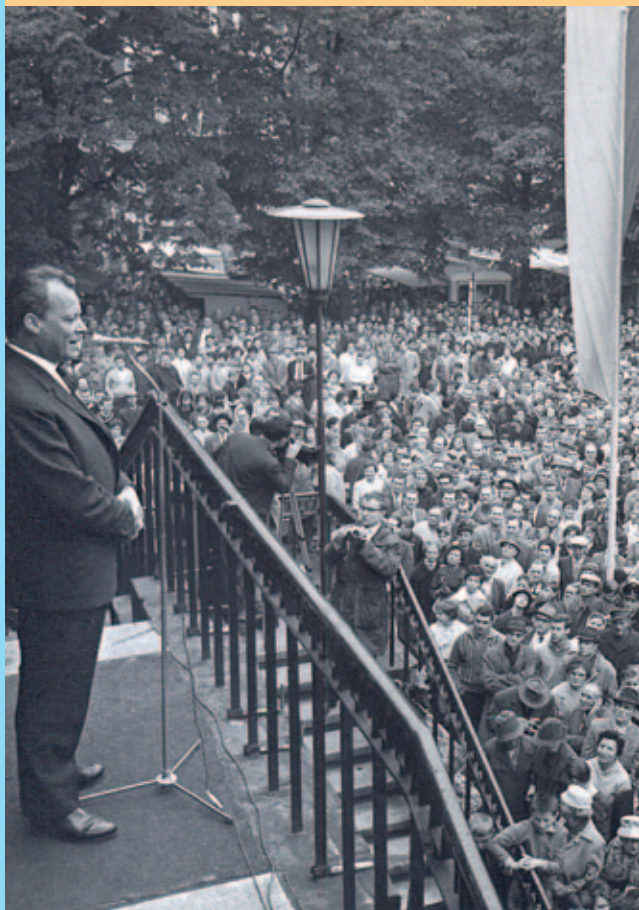
Willy Brandt als Wahlkampfredner 1966