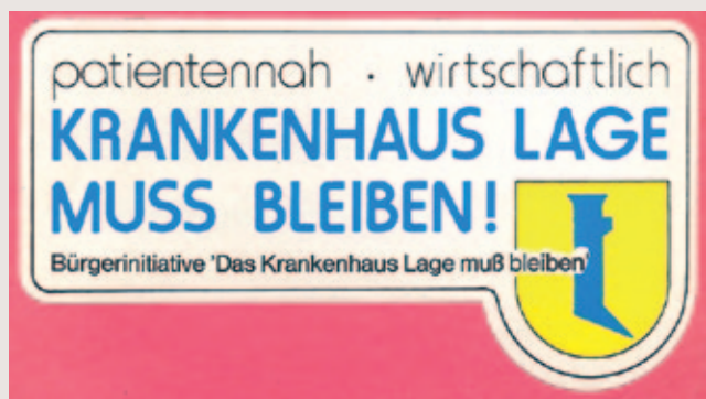
Aufkleber der Bürgerinitiative „Das Krankenhaus Lage muss bleiben“, 1980

Tel.: 0 52 32 / 60 14 71 | E-Mail: stadtarchiv@lage.de