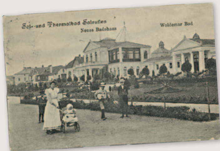
Blick auf die Badehäuser 1909 (Stadtarchiv Bad Salzuflen)

Gelbe Schule | Martin-Luther-Straße 2 | 32105 Bad Salzuflen Tel.: 0 52 22 / 95 29 20 | E-Mail: archiv@bad-salzuflen.de